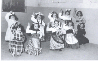
ANNO SCOLASTICO 1958/59 – Danza folcloristica in costume