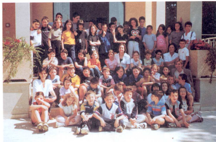
Alumni e Insegnanti 2° Ciclo