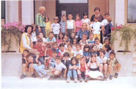
Alumni e Insegnanti 1° Ciclo